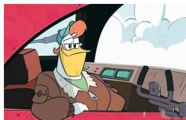
它在开飞机，没看错的话，它是一只鸟！