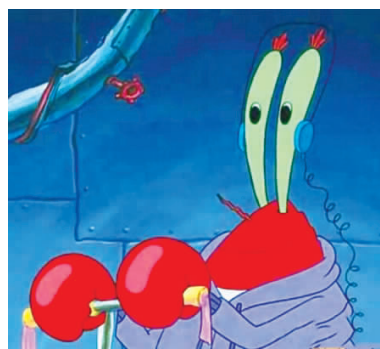
用眼睛听歌，我感觉我的童年受到了伤害！