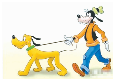
都是狗，一只是宠物而另一只却是主人！到底发生了什么？