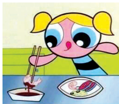
好想知道筷子是怎么拿的？