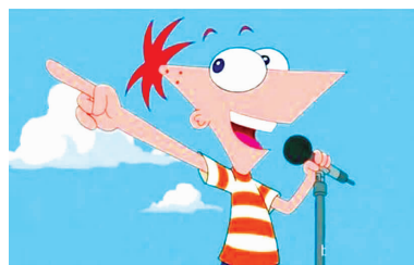
这个孩子究竟是怎样将他的 T 恤穿进去的？